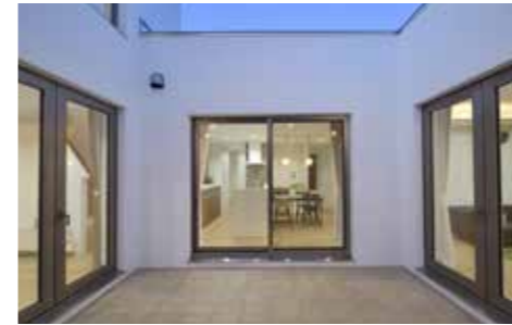
建物の一部をコの字型に抜き取るように設けた中庭。全面タイル敷で、周囲の視線に晒されることなく家族でバーベキューを楽しめる。